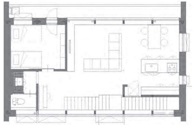
【図3】UA値0.18（プラチナ等級相当）の住宅のプラン 階段ホール、リビング、キッチン、洗面スペースなどがシームレスにつながる

を増やさなくてはならない、という従来の発想から脱却し、高断熱化することで比較的少ないエネルギーで住宅全体を暖房し、住宅内の温度差が小さいという特徴を活かした、間仕切りの少ない開放的な平面プランが特徴的です。