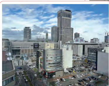
新事務所からの眺望▼