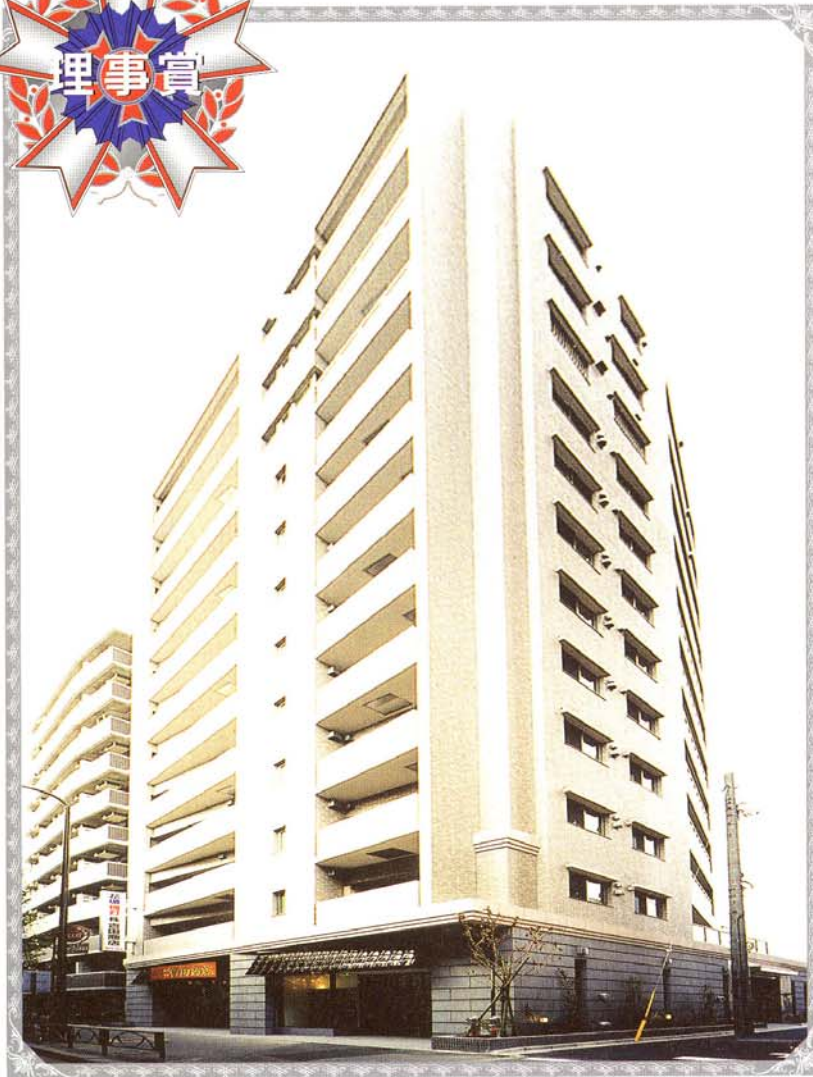
● 理事長賞 ●