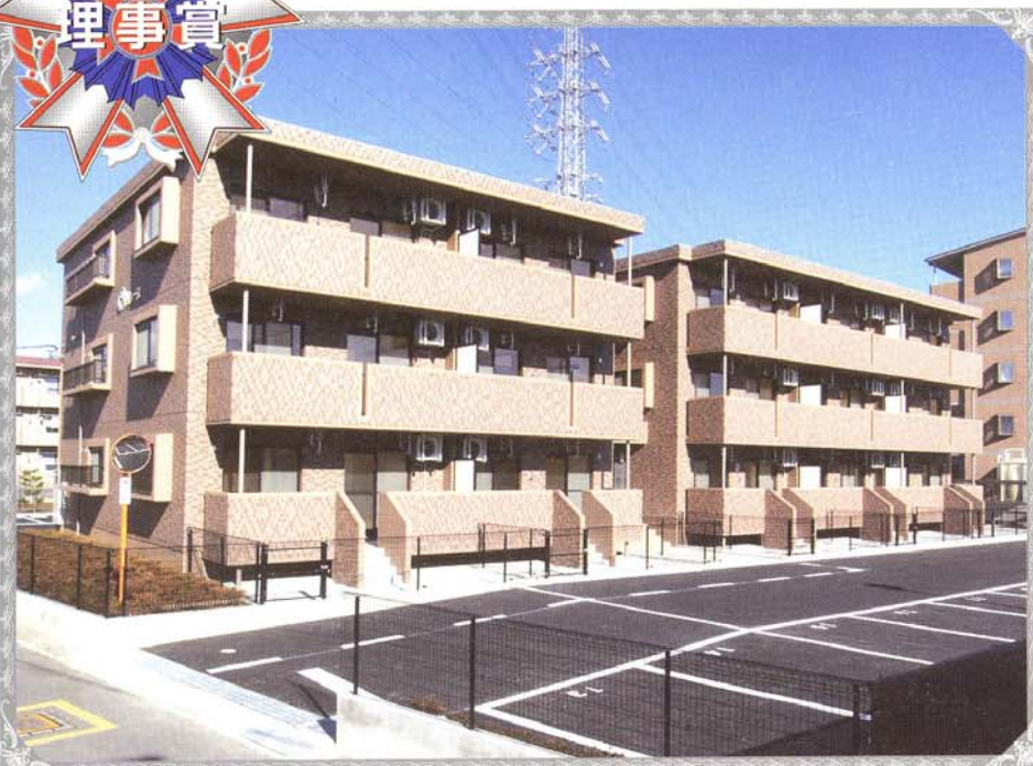
● 理事長賞 ●