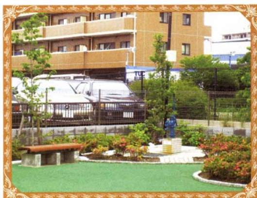
※災害用避難空地に設置された防災井戸、かまどになるベンチ