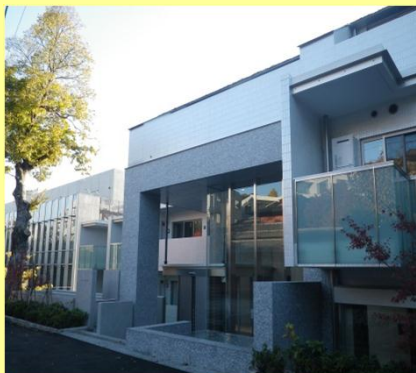
【外観2】(賃貸住宅のエントランス)