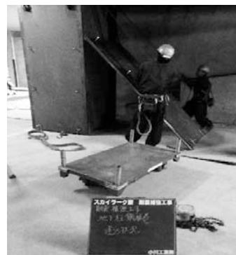
【室内から見た耐震補強後】