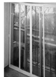
外窓工事前（3枚引き）