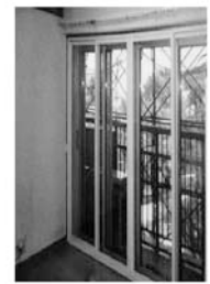
外窓工事後（4枚引き）