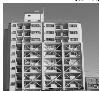
【地下駐車場の耐震補強】